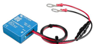
Détection Bluetooth Smart Battery Sense