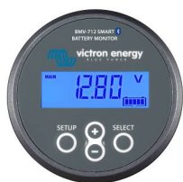
Détection Bluetooth BMV-712 Smart Battery Monitor