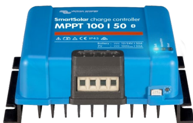
Contrôleur de charge SmartSolar MPPT 100/50